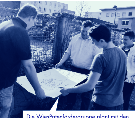
Die WiesPatenfördergruppe plant mit den WiesPaten Firma Brömer und Firma Baumstark einen Supergrill für das Trafohaus.

Dank des Clubs Round Table 131 aus Wiesbaden konnten einige Jugendliche im März an einem Bewerbungstraining mit echten Chefs teilnehmen.