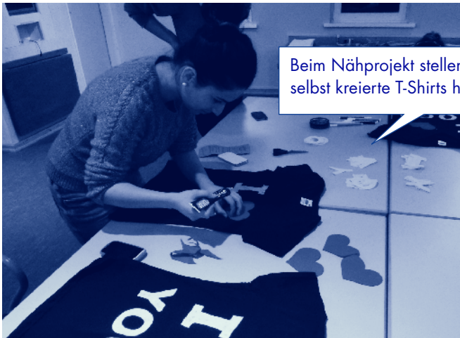
Beim Nähprojekt stellen die Mädchen selbst kreierte T-Shirts her.