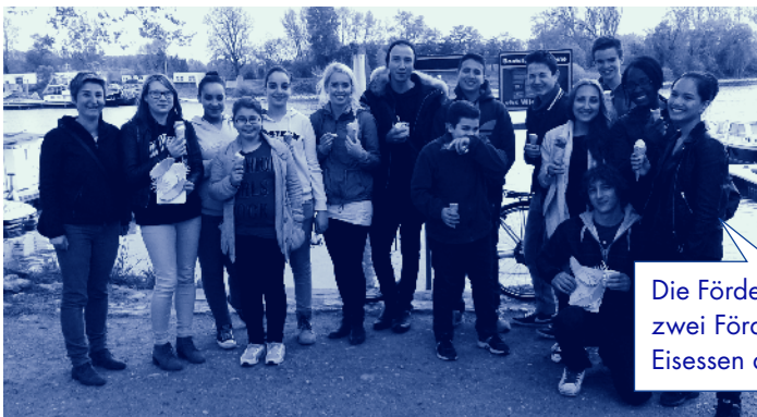
Die Fördergruppen verabschieden zwei Förderlehrer bei einem leckerem Eisessen am Schiersteiner Hafen.