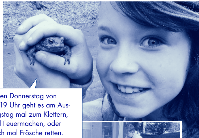
Jeden Donnerstag von 16-19 Uhr geht es am Ausflugstag mal zum Klettern, mal Feuermachen, oder auch mal Frösche retten.